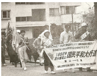
組合員・職員多数参加した平和行進

「戦争は二度と起こしてはいけない、孫を戦争に送ることは許さない」という丸岡町の組合員さんの戦争体験手記も掲載され、医療生協として平和への想いを組合員さん・職員が深く共有する紙面になっています。