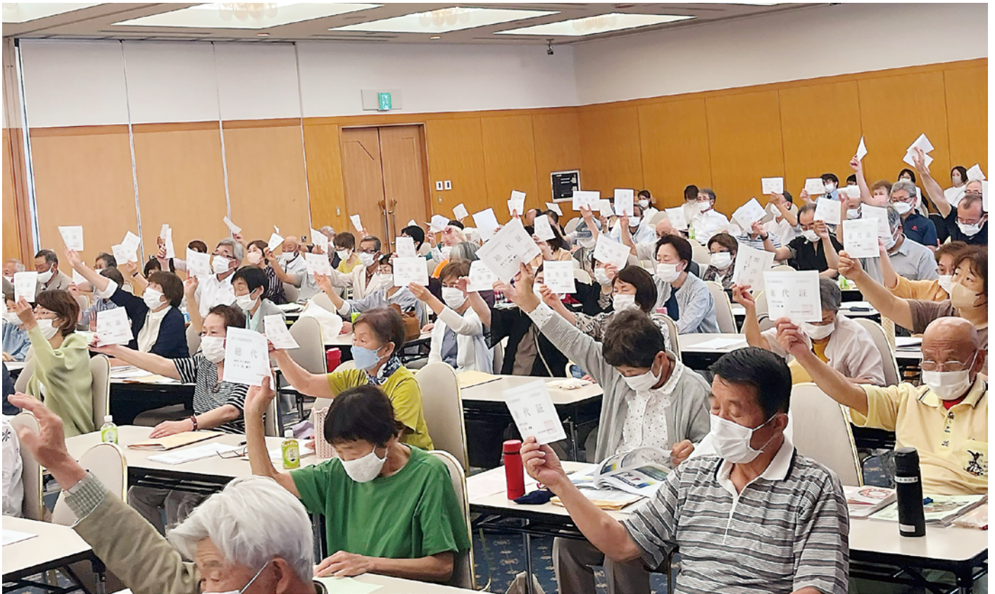
福井県医療生協の第47回総代会が6月15日に開かれ、質疑や討議が活発に行われました。