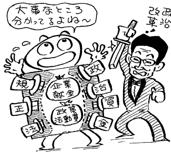
国民の目はだませない

*おハガキを出す際には、クロスワードパズルの答え・住所・氏名などの記入漏れがないか、ご確認ください。