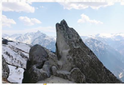
2022年5月燕岳(長野県)登山で撮影