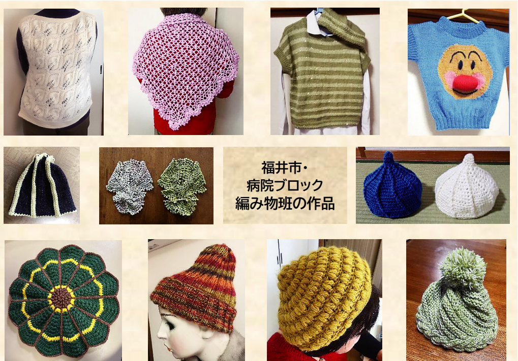
福井市・病院ブロック 編み物班の作品